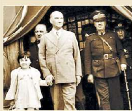
✓ 23 Nisan 1920 tarihinde TBMM'nin açılış nedeniyle bayram olarak kutlanmaya başlanan 23 Nisan, aynı zamanda Ulu Önder Mustafa Kemal Atatürk tarafından çocuklara armağan edilmişti. Türkiye Cumhuriyeti'nin önemli bir yapı taşı olan TBMM'nin önemine dikkat çeken iş dünyası temsilcileri mesajlarında cumhuriyet ve demokrasiye vurgu yaptılar.

Bu ülkeyi ve TBMM'ni bizlere emanet eden başta Gazi Mustafa Kemal Atatürk ve silah arkadaşları, rahmet ve minnetle anıyorum. Bu duygu ve düşüncelerimle tüm