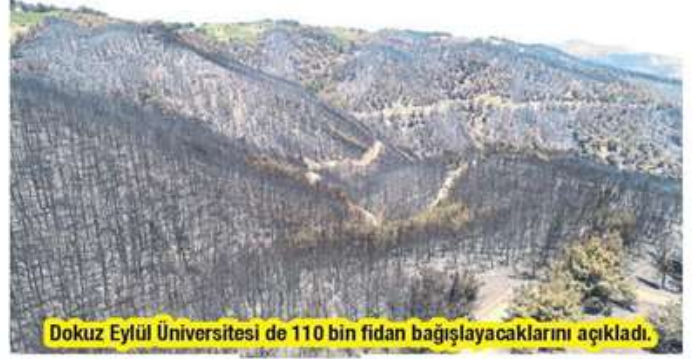
Dokuz Eylül Üniversitesi de 110 bin fidan bağışlayacaklarını açıkladı.

'Hedef 1 Milyon Fidan' adı altında yürütülecek kampanyaya katılmak isteyen oda, borsa ve birlik üyeleri ve vatandaşlar, Ege Orman Vakfı'na ait, (Denizbank Ege Ticari Merkez Şubesi'ndeki) TR47 0013 4000 0042 5403 9000 01 IBAN hesabına fidan bağışında bulunabilecek. Kampanyaya katılanlar 10 TL karşılığında bir fidan bağışlayarak yanan alanların yeşillendirilmesine katkıda bulunabilecek.