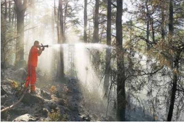
İzmir / E.Çözüm

Geçtiğimiz günlerde İzmir'in çeşitli yerlerinde çıkan orman yangınları sonrası kentte adeta fidan dikme seferberliği ilan edildi. İzmir'deki STK'ların ve futbol kulüplerinin yoğun destek verdiği kampanyaya sayısız vatandaş da katılım gösteriyor. 500 hektarı küle çeviren yangında yok olan ağaçların yerine 1 milyon fidan dikimi hedefleniyor.