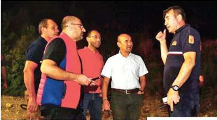
İBB Başkanı Tunç Soyer, yangın süresince bölgede incelemelerde bulundu

● Kentteki 9 sivil toplum kuruluşu, Ege Orman Vakfı ile el ele vererek, "Hedef 1 Milyon Fidan" kampanyasını başlattı. Tarım ve Orman Bakanlığı Orman Genel Müdürlüğü ile İzmir Ticaret Odası (İZTO), Ege Bölgesi Sanayi Odası (EB-SO), İzmir Ticaret Borsası (İTB), İME-AK Deniz Ticaret Odası İzmir Şubesi (DİTO), Ege İhracatçı Birlikleri (EİB), Ege Sanayicileri ve İş İnsanları Derneği (ESİAD) Ege Genç İş İnsanları Derneği (EGLAD), İzmir Sanayici ve İş İnsanları Derneği (İZSİAD) ve Müstakil Sanayici ve İşadamları Derneği İzmir Şubesi (MÜSİAD) tarafından başlatılan kampanyada 1 milyon fidan dikilmesi hedefleniyor. Yürütülecek kampanyaya katılmak isteyen üyeler, vatandaşlar Ege Orman Vakfı'na ait TR47 0013 4000 0042 5403 9000 01 IBAN nolu hesaba fidan bağışında bulunabilecek.